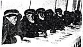
ብዕዕ ወቅቶ ለቡን ማርቆሎስ ቅዱስ ሲኖዶስ ሲጠሩ

የ፲፱፻፹፫/ም ጉባኤ ጥቅምት ፲፪ ቀን ተጀምሮ ተከናውኗል ። ጉባኤው በሚከፈትበት ከላይ በተጠቀሰው ቀን ዋይማኖት ስርዓት በኋላ በ፲ ሰዓት ከጫ ደቂቃ ብዕዕ ወቅቶ ለቡን ማርቆሎስ ፓትርያርክ ርእሰ ሊቃና ጳጳሳት ዘኢትዮጵያ ከብዕዓን ሊቃና ጳጳሳት ጋር በመሆን መንበረ ፀባዖዕት ቅድስት ሥላሴ ካቲድራል በደረሱ