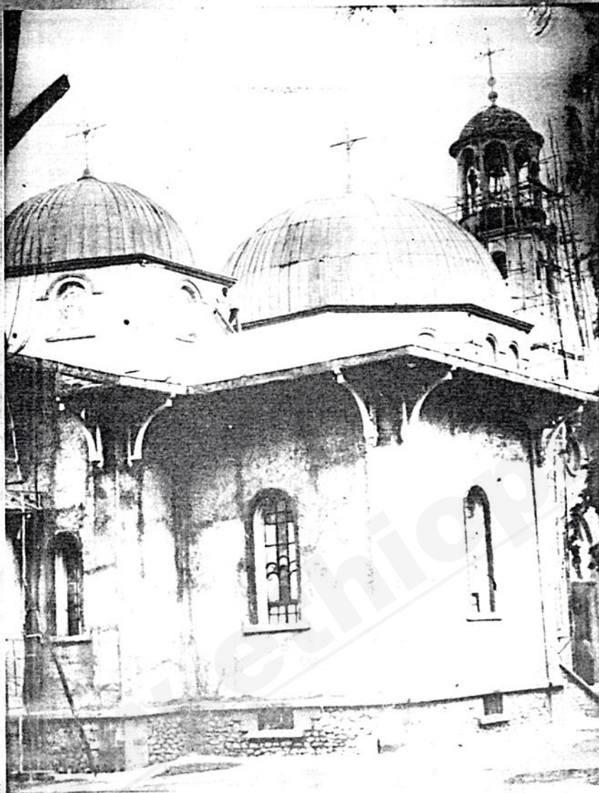
በመታደስ ላይ የሚገኘው የቅዱስቲ ቅዱሳን ማርያም ቤተ ክርስቲያን