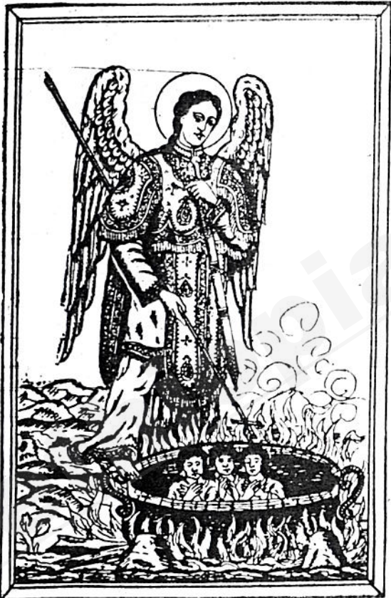
ቅዱስ ገብርኤል የቱድቱን ከላት እንደሚኖር

በመድረስ ታቦተ ገብርኤልን ይህ ወደ አከስም ጽዮን ለመሔድ መንገድ ይጀምራል መልአኩ ቅዱስ ገብርኤል በራዕይ ተገልጾ ታቦተ ገብርኤልን እንደያዘ